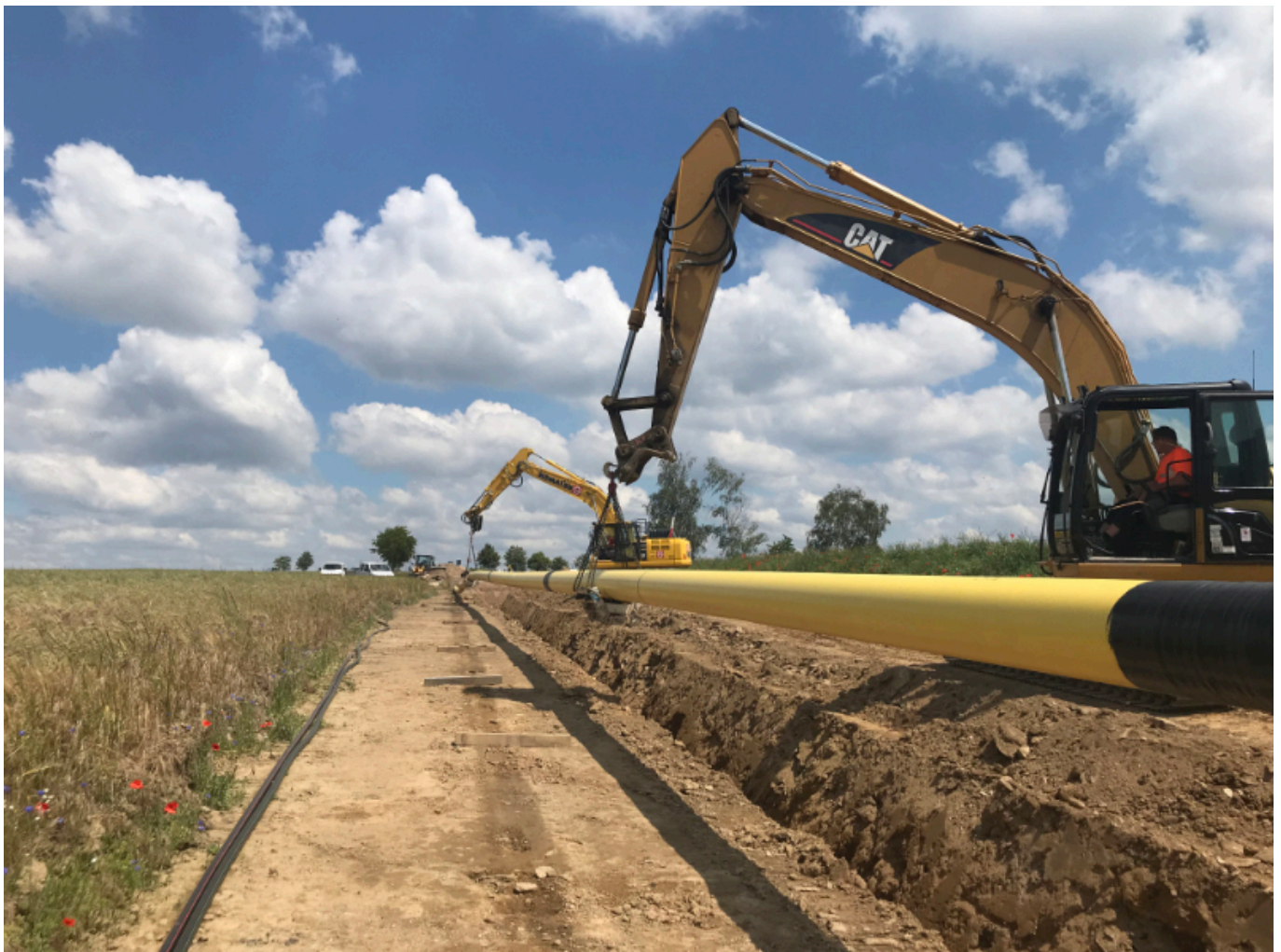
Leitungsbau bei der ONTRAS Gastransport GmbH.

Bereits ansässig ist in Leipzig die European Energy Exchange (EEX) als weltweit agierende Energiebörse, an der unter anderem Strom, Erdgas und CO 2 -Emissionsrechte gehandelt werden. Die EEX arbeitet ebenfalls an der Etablierung eines Handelsmarkts für Wasserstoff. Wesentliche Instrumente dafür sind der Preisindex HYDRIX sowie die Entwicklung einer Wasserstoff-Handelsplattform. Dabei arbeitet die EEX mit der Hintco GmbH zusammen.