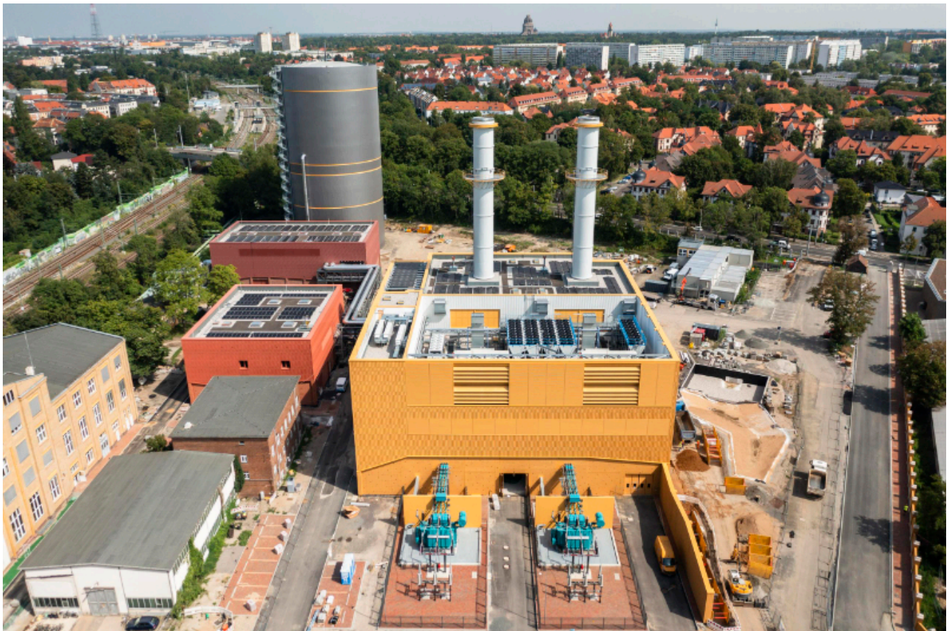
Das wasserstofffähige Heizkraftwerk Leipzig-Süd

Sachsen“ hat errechnet, dass bis zum Jahr 2030 rund 4.800 Arbeitsplätze und etwa 1,7 Milliarden Euro Umsatz bei sächsischen Unternehmen durch die Wasserstofftechnologie entstehen könnten. Deshalb wird nicht nur in Dresden, sondern auch in Leipzig bereits an der Wasserstoffzukunft gearbeitet. Beispielsweise im Projekt „ LHyVE – Leipzig Hydrogen Value chain for Europe “. In diesem Projekt kooperieren u.a. die Leipziger Gruppe (dazu gehören etwa die Leipziger Verkehrsbetriebe GmbH und die Stadtwerke Leipzig GmbH ), die ONTRAS Gastransport GmbH , die EDL Anlagenbau GmbH , die VNG AG , das Wasserstoffnetzwerk HYPOS e.V. und viele weitere Partner aus der Wirtschaft, Wissenschaft und Industrie bei ihren Wasserstoff-Aktivitäten.