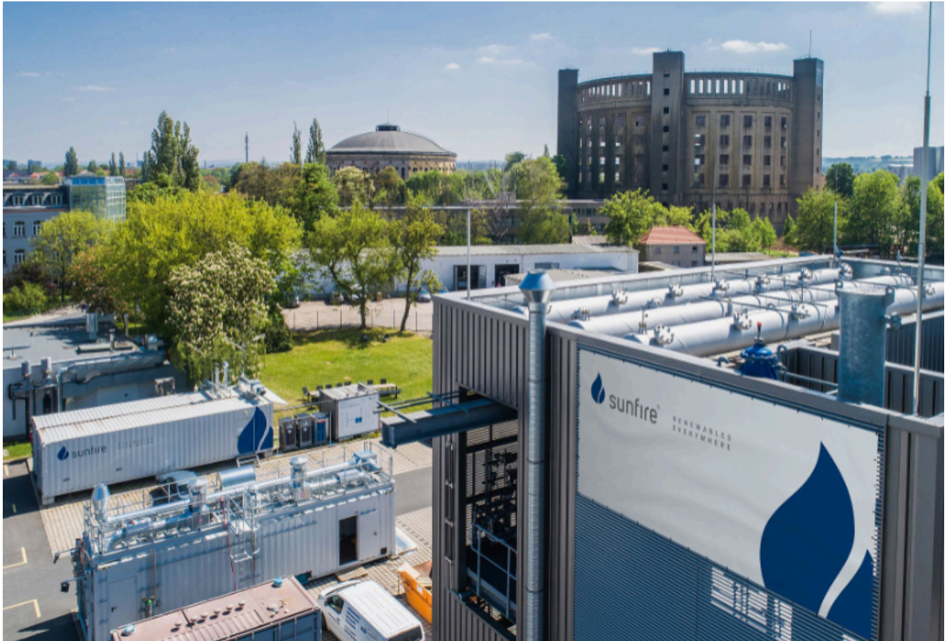
Die Dresdner Sunfire GmbH wirkt am Aufbau der ostdeutschen Wasserstoffindustrie mit.

dafür insgesamt 162 Millionen Euro an staatlicher Unterstützung. Das Vorhaben, „Sunfire 1500+“ getauft, umfasst die Fertigung von Elektrolyseuren sowohl für die Alkali-Technologie (AEL) als auch für die Hochtemperatur-Technologie (SOEC). Sunfire ist seit 2011 in Sachsen ansässig. Ihre innovativen SOEC-Elektrolyseure zur Herstellung von grünem Wasserstoff wurden bereits an Industriepartner wie RWE oder die Salzgitter AG verkauft.