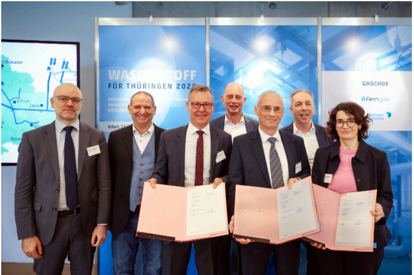
Im Beisein von Wirtschaftsminister Wolfgang Tiefensee (4.v.l.) unterzeichneten die drei Netzbetreiber eine Grundsatzvereinbarung zur Kooperation bei der H2-Gasnetzumstellung.

2029 stehen zwölf Vorhaben der Projektpartner zur Umstellung auf Wasserstoff auf dem Plan. Laut der drei Netzbetreiber arbeiten gegenwärtig 50 große Erdgasverbraucher in Thüringen, von denen rund die Hälfte beim Verzicht auf Erdgas auf Wasserstoff angewiesen wäre.