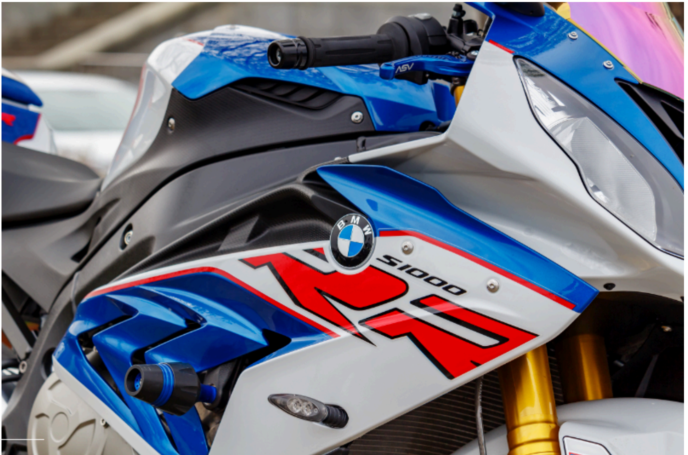
BMW Motorrad.

Das Cluster Verkehr, Mobilität und Logistik beschäftigt in rund 8.400 Unternehmen in Berlin 112.000 Mitarbeitende mit einem Umsatz von 17,4 Milliarden Euro. Im Automotive-Sektor sticht vor allem das BMW-Werk für Motorräder hervor. Bereits seit 1969 rollen in Spandau die bayerischen Zweiräder vom Band. Ein Teil der bis zu 800 Motorräder, die BMW täglich in Berlin produziert, sind elektrische Modelle. Das Spandauer Motorradwerk der BMW Group zählt zu den wichtigsten Industriebetrieben in der Hauptstadt.