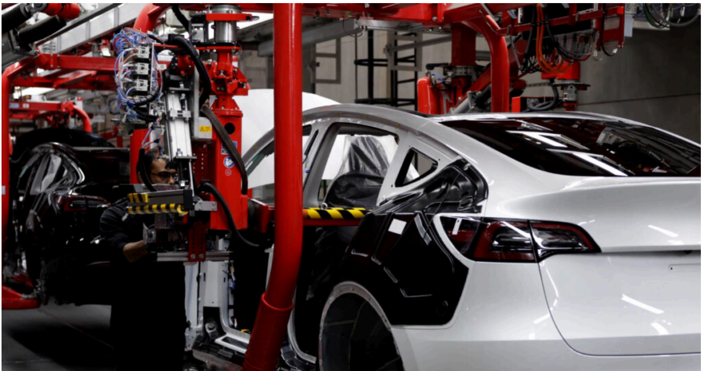
Tesla in Grünheide – die Montage.

Von der lackierten Karosserie zum fertigen Fahrzeug