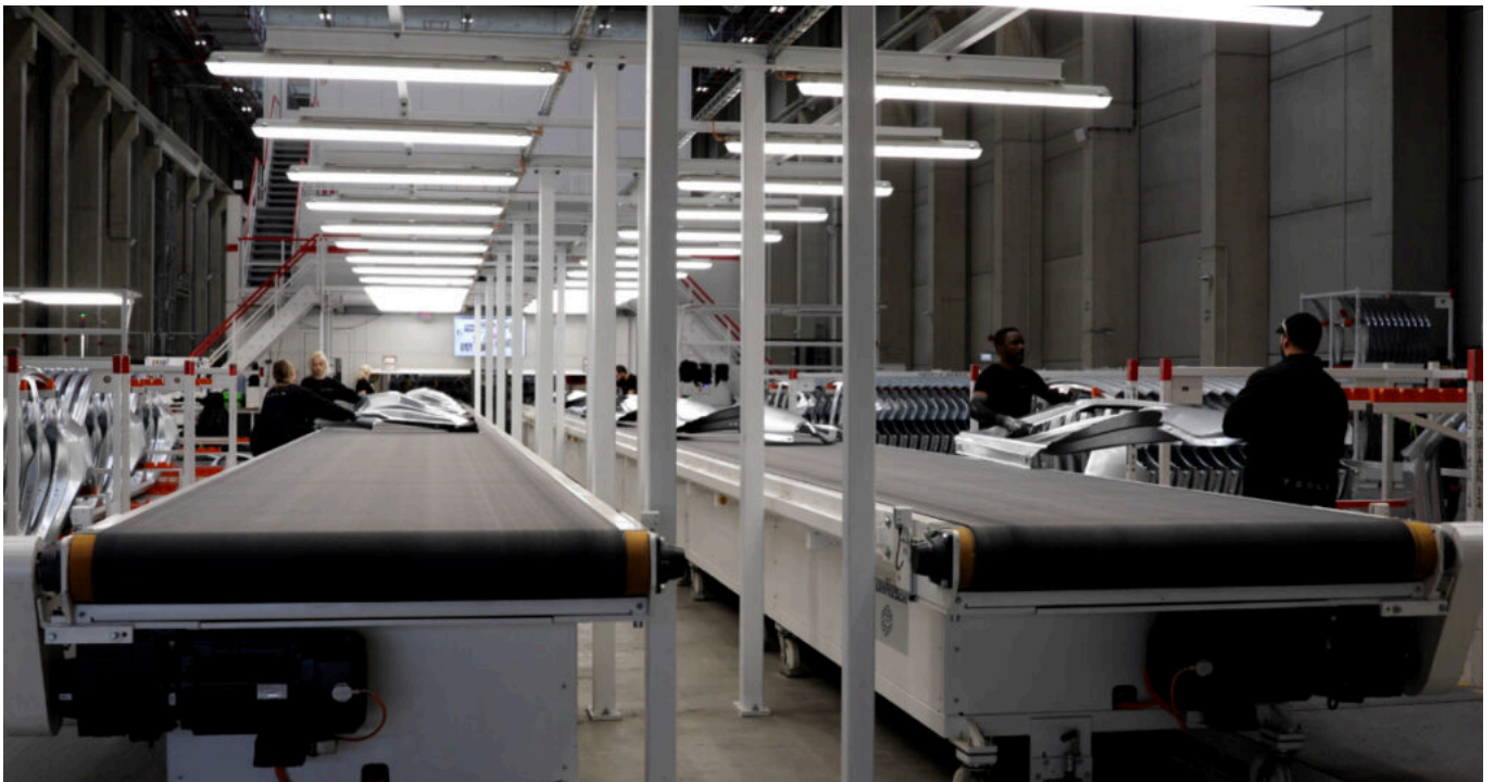
Tesla in Grünheide – das Presswerk.

Zu den Teilen gehören die Haube, Türen, Heckklappe, Kotflügel und Seitenwand – insgesamt 17 Teile: Die Presseinsätze formen mit bis zu 2.500 Tonnen Druck knapp alle vier Sekunden 1-2 Teile aus angelieferten Aluminium- und Stahlplatten. Die Presseinsätze können schnell und effizient ausgetauscht werden, um verschiedene Teile zu produzieren.