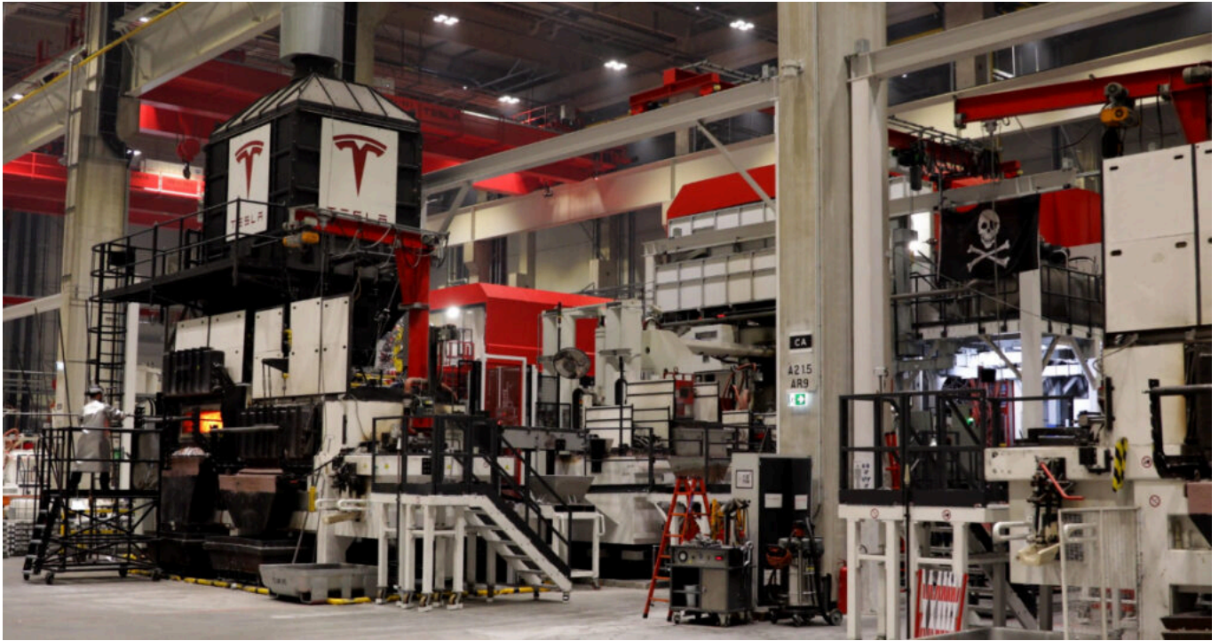
Tesla in Grünheide – die Gießerei.

Diese Produktionsmethode ermöglicht eine nie dagewesene Reduktion der Bauteilkomplexität und Fahrzeugstabilität. Aluminiumrohlinge (Barren) werden bei 700 Grad eingeschmolzen und in die weltweit größte Druckgussmaschine eingespritzt. Mit über 6.000 Tonnen Druck wird die flüssige Aluminiummasse dann in Formen gepresst, in kürzester Zeit abgekühlt und entnommen.