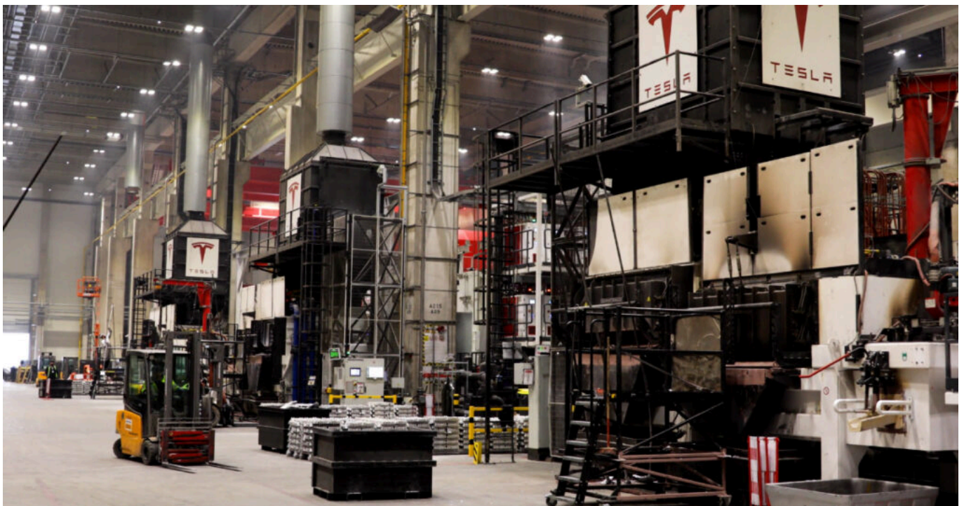
Tesla in Grünheide -Gießerei.

Hier werden die zwei weltweit größten Karosserieteile in einem Druckgussverfahren (vorderer und hinterer Unterboden) hergestellt.