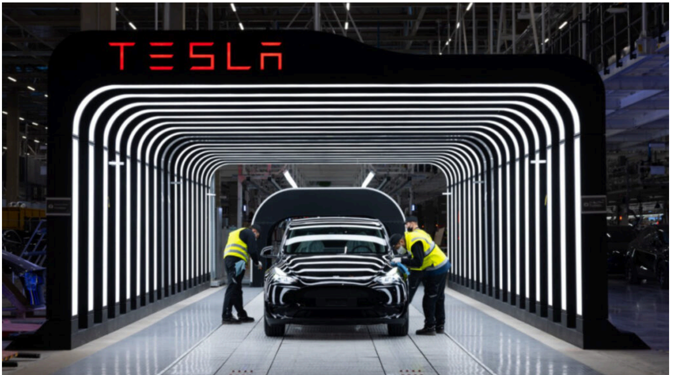
Tesla in Grünheide – der Lichttunnel.

Dabei wird die Karosserie mit dem Antriebsstrang verbunden (Batterie, Vorder- und Hinterachse inkl. der Antriebsmotoren). Nachdem Räder, Sitze, Türen und Scheiben verbaut wurden, läuft das Fahrzeug am Ende durch den Lichttunnel und steht zum Abtransport bereit.