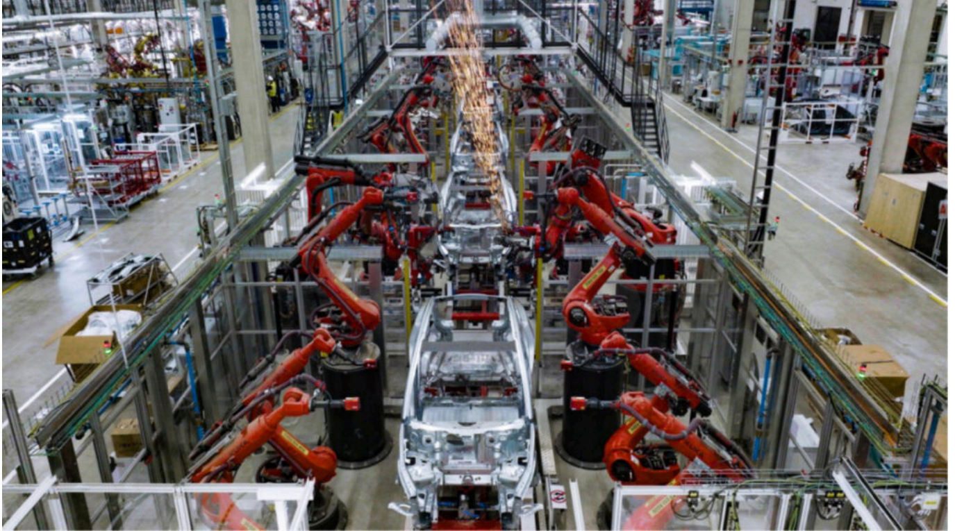
Tesla in Grünheide – der Karosseriebau.

Im Karosseriebau beginnt der Herstellungsprozess des Model Y