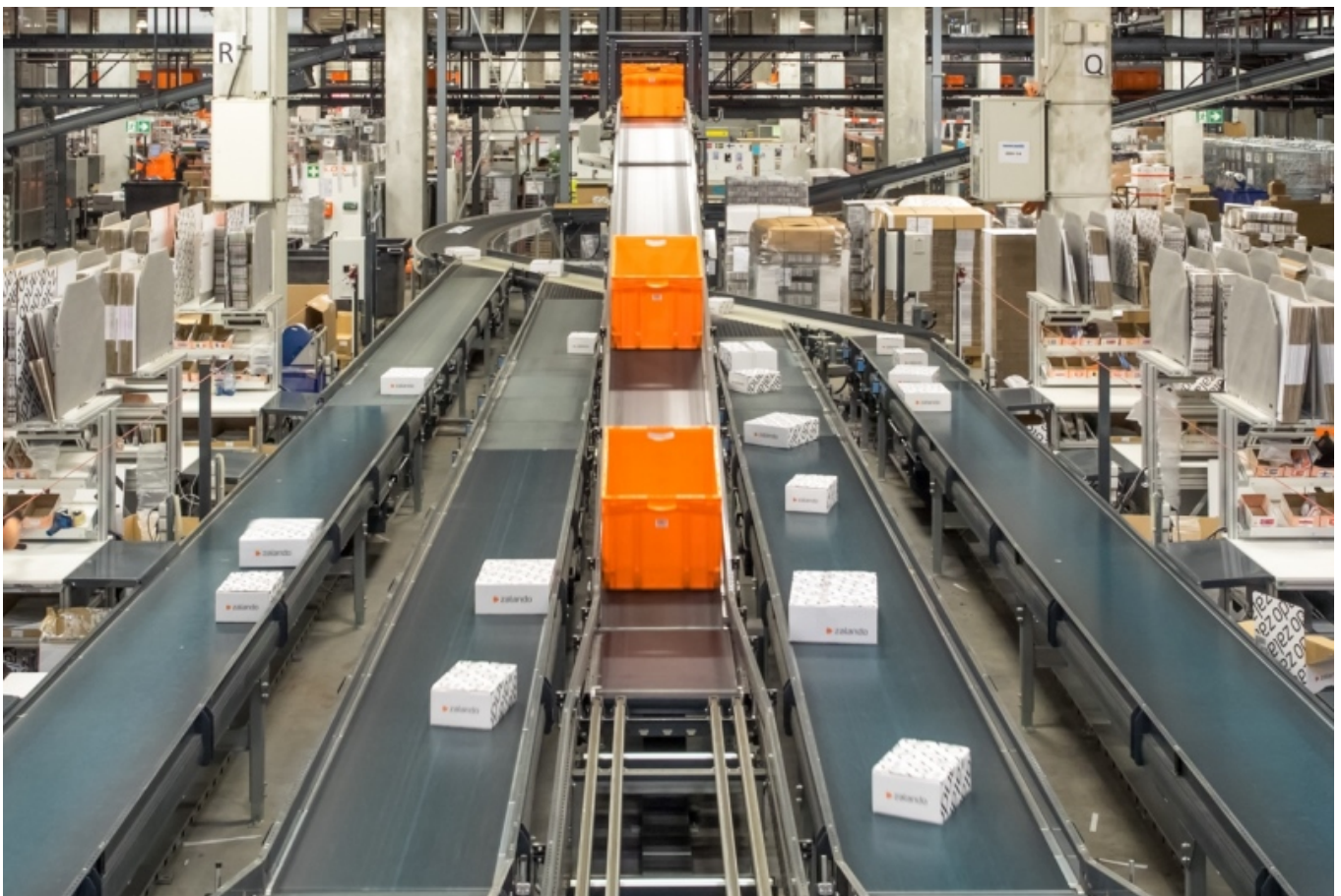
Logistikzentrum von Zalando in Erfurt.

Derweil brummt es auf Thüringens Autobahnen. Aufgrund der zentralen Lage haben sich laut Landesamt für Statistik in Thüringen rund 2.600 Logistik-Unternehmen mit etwa 34.000 Beschäftigten angesiedelt. DHL, DB Schenker, Kühne + Nagel, Dachser, Rhenus, Zalando, Zeitfracht oder Amazon – alle Großen der Branche verfügen über ein Standbein im Thüringer Land. Zentrale Standorte sind die Erfurter Logistik-Gewerbegebiete, das