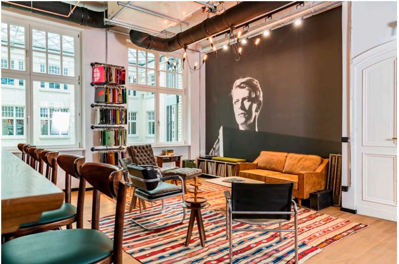
Coworking Berlin

Ein dritter Arbeitsort wird an Bedeutung gewinnen: wohnortnahe Coworking-Spaces. Hier kommen zwei Vorteile zusammen, die Büro und Home-Office in der Regel nicht gleichzeitig bieten: kurze Fahrzeiten und der Komfort eines modernen, ergonomischen Arbeitsplatzes. Arbeitgeber haben so die Sicherheit, dass die Mitarbeiter dort auch arbeiten und nicht während der Arbeitszeit im Wohnzimmer staubsaugen. Arbeitnehmer wiederum haben mehr sozialen Austausch als am heimischen Küchentisch. Im Idealfall bilden mehrere Mitarbeiter eines Unternehmens gemeinsam ein Satelliten-Büro und sind dank moderner Technik mit Ihrer Firma so vernetzt, als säßen sie nur eine Etage tiefer.