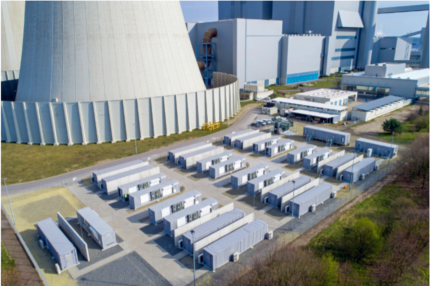
Der größte Batteriespeicher Europas steht in der Lausitz.