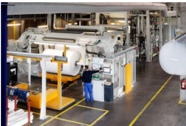
Beschichtungsmaschine, Ioannidis Polykarpos