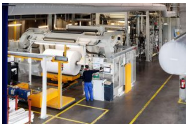
Beschichtungsmaschine, Ioannidis Polykarpos