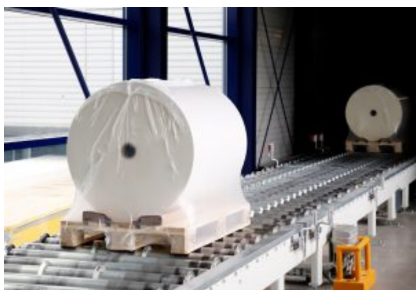
Fertig verpackte Rollen werden per Förderband in die Spedition transportiert

Der Etikettierexperte Herma investiert die höchste Summe der Unternehmensgeschichte in ein neues Beschichtungswerk und nutzt dafür eine attraktive KfW-Förderung für Energieeffizienzvorhaben.