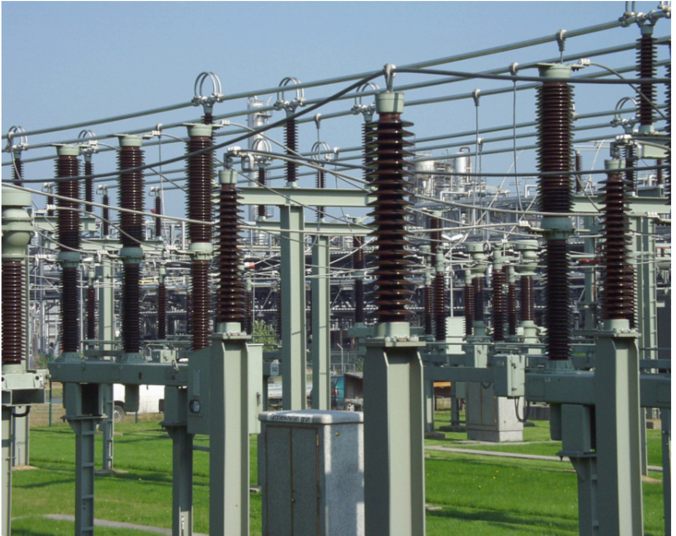
EWE Umspannwerk.

Wie die EWE die Energiewende in Brandenburg vorantreibt