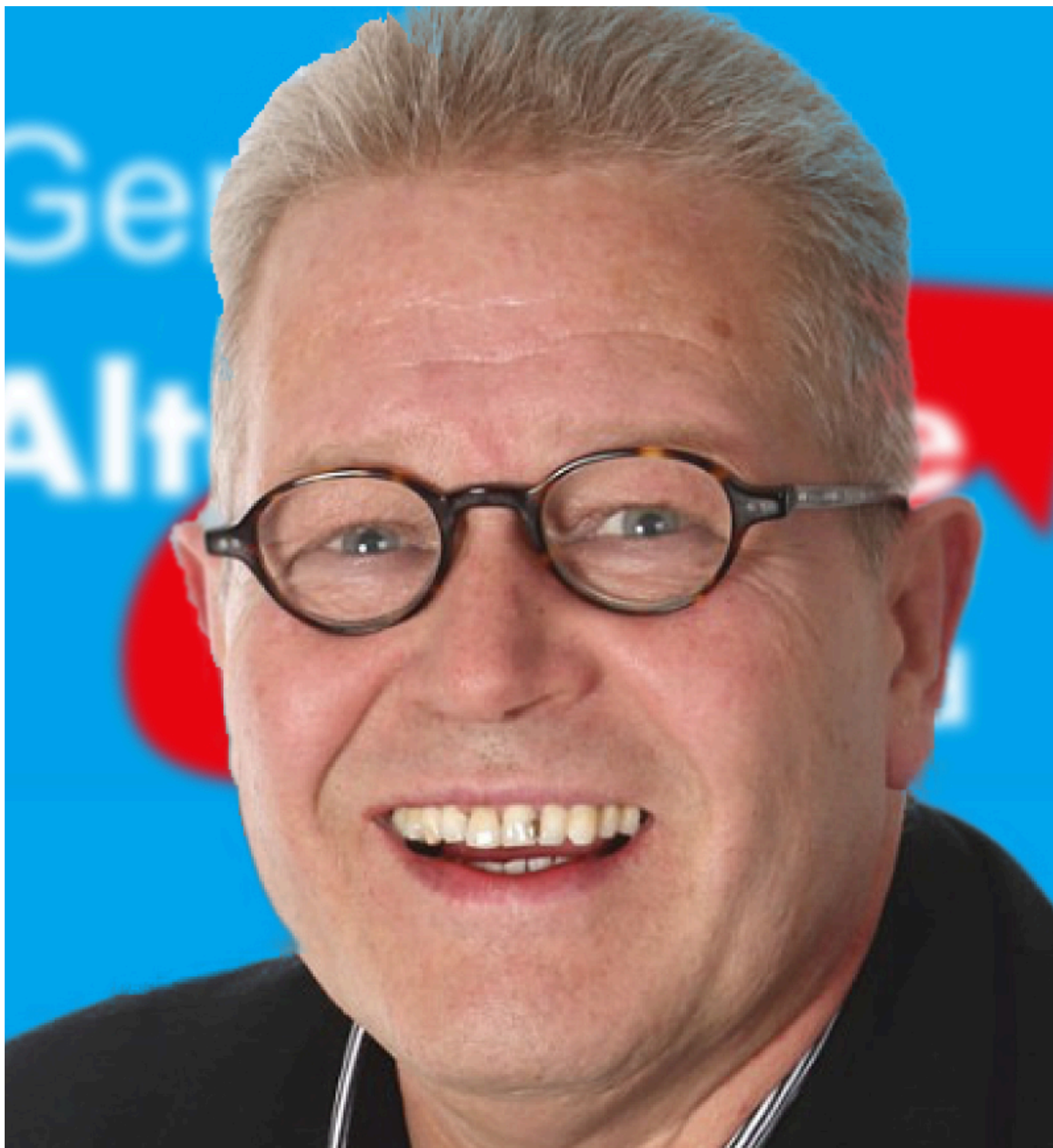
Dieter Laudenbach (AfD), Sprecher für Wirtschaft der AfD-Fraktion.

Subventionen sind prinzipiell immer nur die zweitbeste Lösung, doch stehen wir nun einmal im Internationalen Wettbewerb und können uns deswegen solchen Maßnahmen nicht gänzlich verweigern.