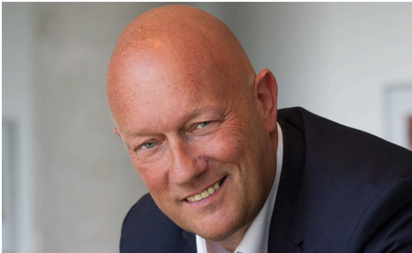
Thomas L. Kemmerich (FDP), Vorsitzender der FDP Thüringen.

Bei jeder geplanten Subvention bedarf es einer konsequenten volkswirtschaftlichen Abschätzung der Folgen.