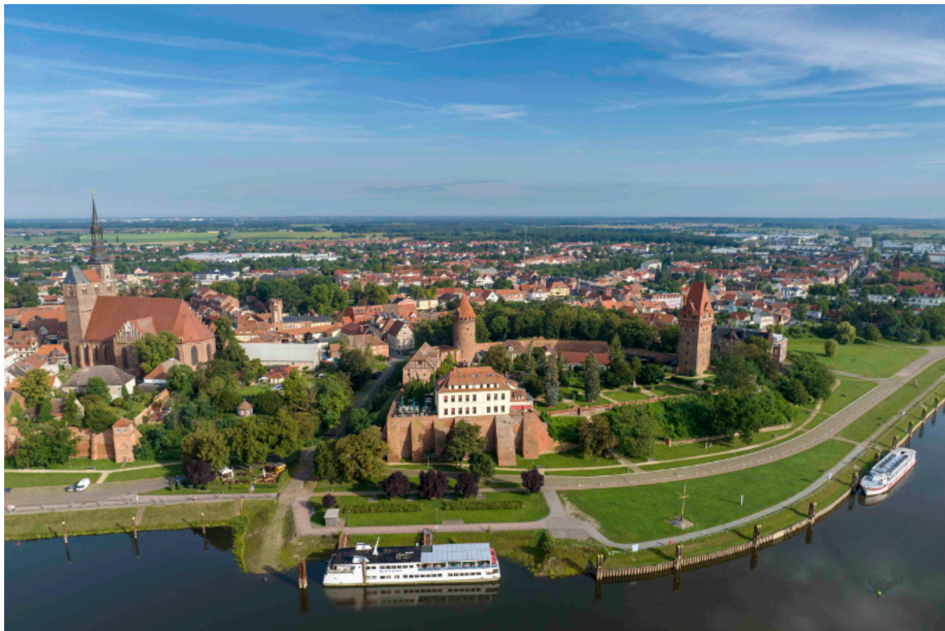
Burg und Schlosshotel in Tangermünde.