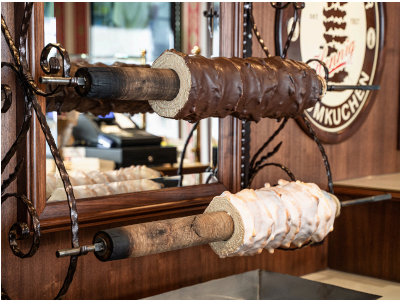
Der Baumkuchen ist Werbeträger der Hansestadt Salzwedel.

Die Milchwerke Mittelelbe, die Altmärker Fleisch- und Wurstwaren GmbH und die Stendaler Landbäckerei GmbH wurden 2022 im NordLB-Ranking der 100 größten Unternehmen Sachsens-Anhalts ebenso gelistet wie die Paradiesfrucht GmbH mit Standorten in Salzwedel und Klötze. Die Paradiesfrucht GmbH wurde jüngst von der US-Firma Thrive Freeze Dry, einem weltweit führenden Hersteller von gefriergetrockneten Lebensmitteln, übernommen.