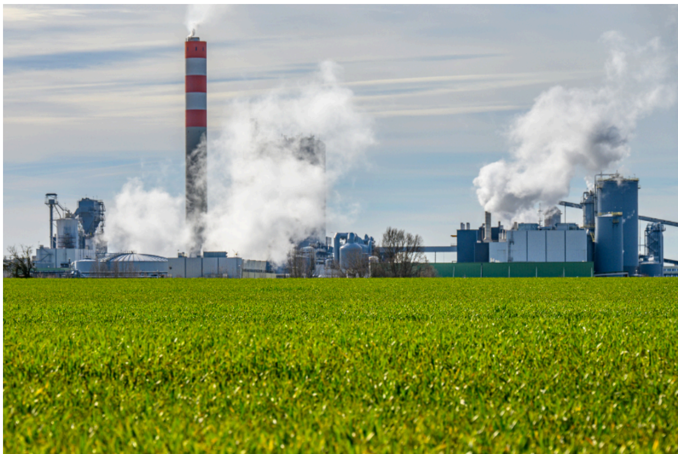
Der Industrie- und Gewerbepark Altmark (IGPA) ist der erste Zukunftsort der Altmark.

13 Zukunftsorte hat das Land Sachsen-Anhalt bisher ausgezeichnet. Orte, an denen sich Cluster rund um zukunftsfähige Industrie- und Forschungkerne bilden. Die Altmark im Norden des Landes – die Region um die Städte Stendal, Salzwedel, Tangermünde und Gardelegen, eingerahmt zwischen Magdeburger Börde im Süden, dem niedersächsischen Wendland im Westen und der Elbe im Osten – ging lange Zeit leer aus. Mit der Auszeichnung des Industrie- und Gewerbeparks Altmark in Arneburg hat sich das nun geändert.