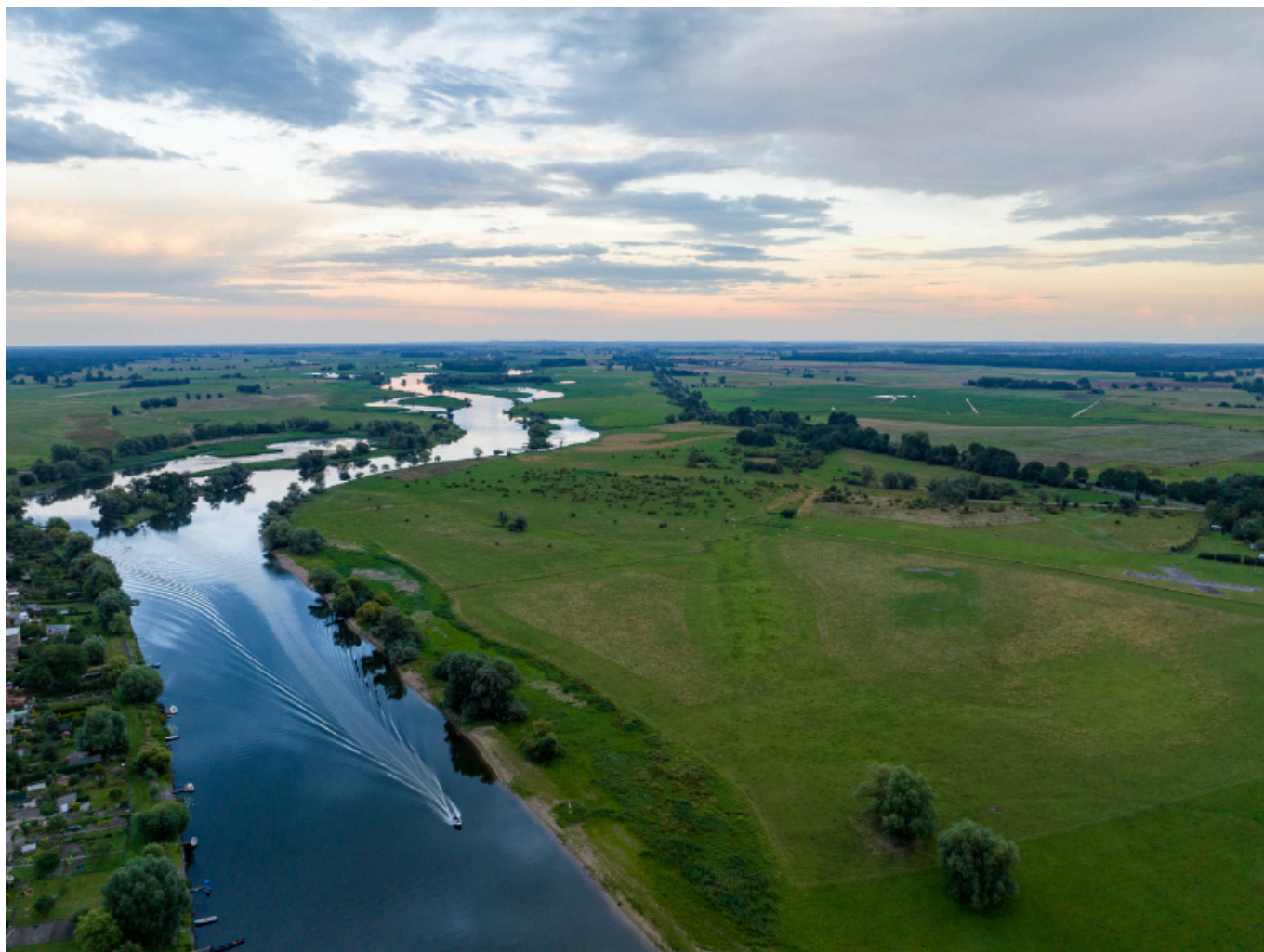
Stadtansichten der Hansestadt Havelberg.