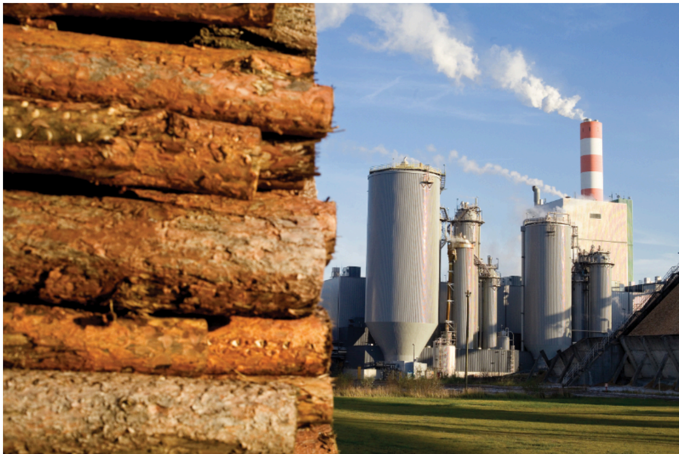
Rund 3,5 Millionen Festmeter Nadelholz verarbeitet Mercer Stendal zu Zellstoff..

Stattdessen errichtete auf dem Gelände 2004 die Mercer Stendal GmbH eines der damals modernsten Zellstoffwerke der Welt. Mercer Stendal, Teil der amerikanisch-kanadischen Mercer International Group, verarbeitet dort jährlich rund 3,5 Millionen Festmeter Nadelholz zu Zellstoff, Bioenergie und verschiedene Biochemikalien. Bis zu 740.000 Tonnen Zellstoff pro Jahr produziert das Unternehmen mit mehr als 450 Beschäftigten, das Werk bildet den industriellen Schwerpunkt der ländlich geprägten Altmark.