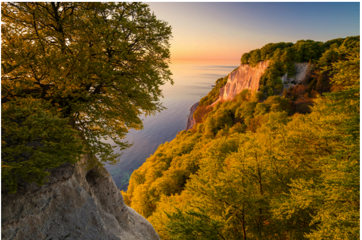
Tourismus in Vorpommern: Abend am Kreidefelsen im Nationalpark Zentrum Königsstuhl . Quelle TMV

Traditionell stehen die beiden Landkreise Vorpommern-Greifswald und Vorpommern-Rügen für den Schiffbau, die Hafenwirtschaft, die Gesundheitsökonomie sowie die Ernährungsbranche. Und natürlich für den Tourismus, der 2024 ganz im Zeichen des 250. Geburtstags von Caspar David Friedrich steht. Der Großmeister der Romantik, der am 5. September 1774 in Greifswald geboren wurde, wird ganzjährig mit Veranstaltungen gewürdigt und soll das Tourismusgeschäft in diesem Jahr kräftig ankurbeln helfen.