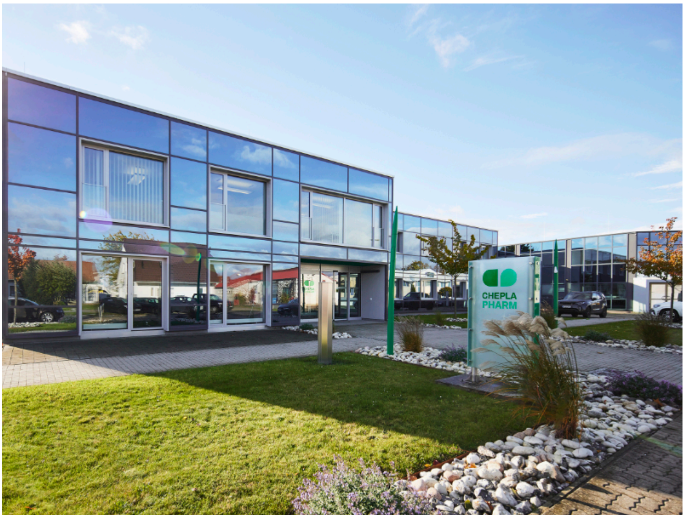
CHEPLAPHARM Arzneimittel GmbH.

Die CHEPLAPHARM Gruppe in Greifswald etwa ist weltweit führend in der Akquisition von Markenmedikamenten. Zuletzt erwarben die Ostseestädter das Zyprexa®-Portfolio von Eli Lilly für einen Kaufpreis von rund 1,3 Milliarden Euro. CEVA , eines der fünf größten veterinärpharmazeutischen Unternehmen weltweit, erforscht auf der Insel Riems innovative Impfstoffe für Haus- und Nutztiere. Die Insel Riems verfügt ohnehin über eine lange Tradition in der Forschung zu Tiergesundheit und Tierseuchenprävention. 1910 gründete Friedrich Loeffler hier im Auftrag des preußischen Kultusministeriums sein Institut zur Erforschung der Maul- und Klauenseuche. Heute setzt das Friedrich-Loeffler-Institut als „Bundesforschungsinstitut für Tiergesundheit“ diese Tradition fort.