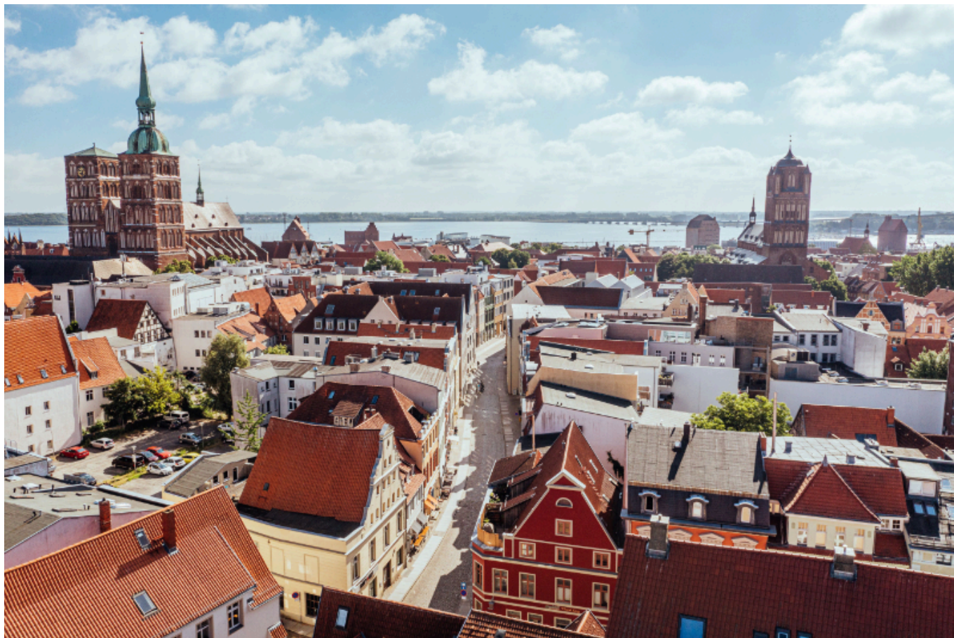
Heilgeiststrasse in der Hansestadt Stralsund.

Die sechs Werftenstandorte in Mecklenburg-Vorpommern haben turbulente Zeiten hinter sich. Die vorpommerschen Werften in Stralsund und Wolgast machen da keine Ausnahme. Am ehemaligen MV Werften-Standort Stralsund ist der Maritime Industrie- und Gewerbepark „Volkswerft“ entstanden. Dort hat sich beispielsweise die Strela Shiprepair angesiedelt, die bereits zahlreiche Handelsschiffe runderneuert hat. Ein Unternehmen, das aus der ehemaligen Abteilung Schiffsreparatur der MV Werft Stralsund hervorgegangen ist. Die Ostseestaal GmbH & Co. KG ist hier bereits seit 1996 auf die Herstellung und Lieferung von geschnittenen und dreidimensional geformten Blechen für Schiffbau, Industrie und Erneuerbare Energien spezialisiert.