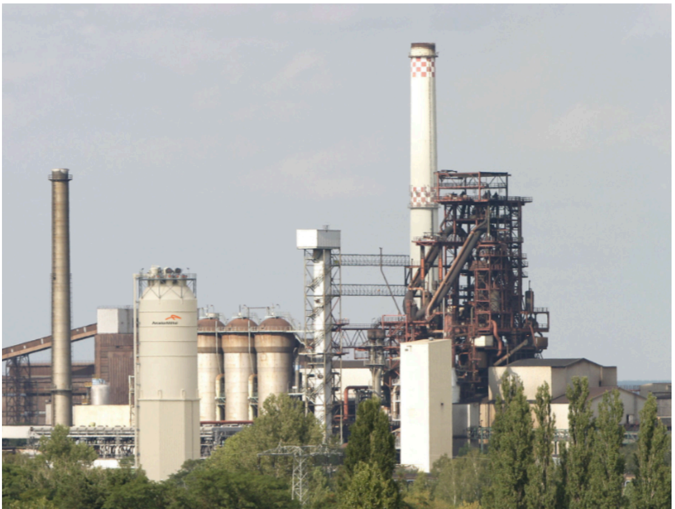
Das ArcelorMittal-Werk in Eisenhüttenstadt.

Die Großindustrie in Brandenburg hat bereits mit der Umstellung begonnen. Der Stahlhersteller ArcelorMittal beispielsweise will seine Stahlerzeugung in