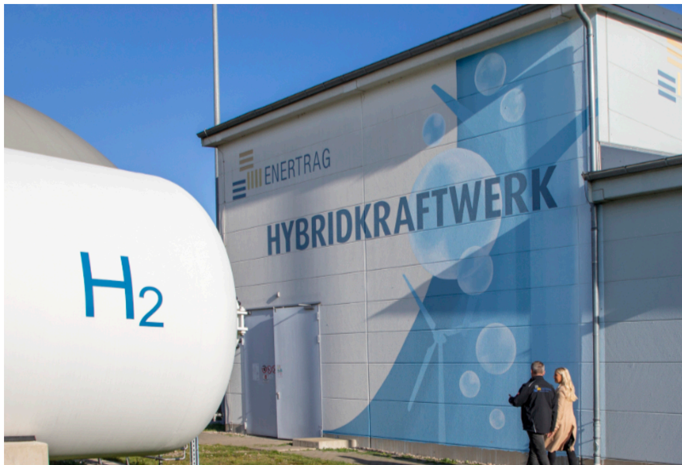
Enertrag Anlagen Hybridkraftwerk Prenzlau.