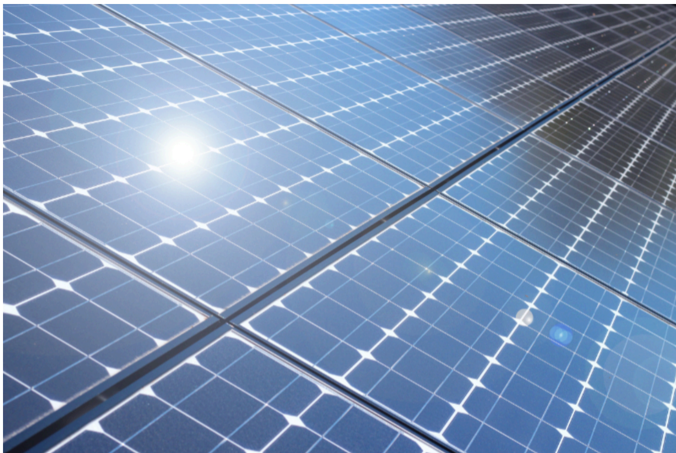
Solaranlage

Die regenerativen Energien für die Transformation der Wirtschaft sollen künftig auch wesentlich aus dem heimischen Land stammen. In Thüringen kommen der Ausbau der erneuerbaren Energien und der Elektromobilität weiter voran, der Freistaat muss aber das Tempo erhöhen. So lautet das Fazit der Thüringer Landesenergieagentur ThEGA für das Energiewende-Jahr 2022.