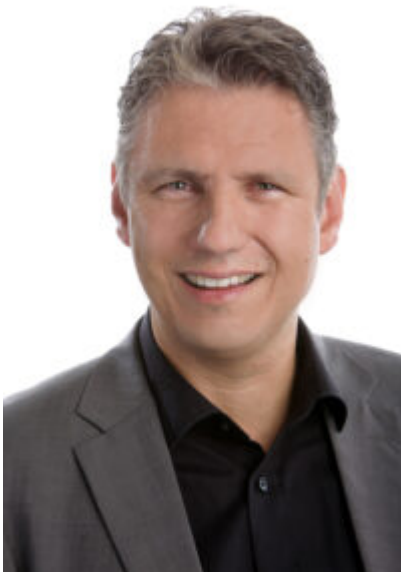
Jens-Uwe Meyer.