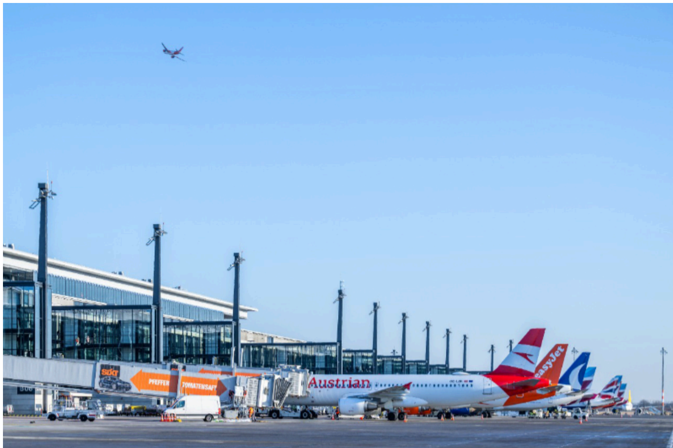
BER Flughafen Berlin-Brandenburg.

Um die wirtschaftliche Entwicklung Ostdeutschlands auch in Zukunft mit der passenden Konnektivität bedienen zu können, müssen wir am BER die Erfordernisse der Region noch besser kennen und besser verstehen. Wir brauchen verlässliche Daten und Informationen, um die Airlines zu überzeugen, dass es wirtschaftlich Sinn macht, den Flughafen BER und damit die gesamte Region in ihr Flugangebot aufzunehmen.