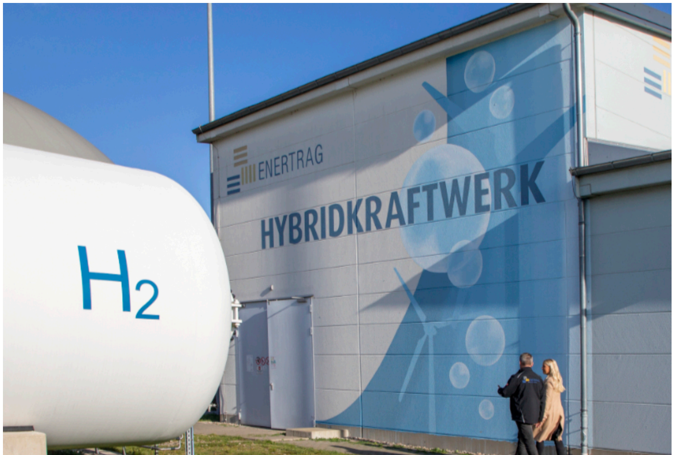
Enertrag Anlagen Hybridkraftwerk Prenzlau.

ENERTRAG, im brandenburgischen Schenkenberg-Dauerthal beheimatet, erbringt Dienstleistungen rund um Erneuerbare Energien. Die 680 Mitarbeitenden bauen, planen und betreiben Energieanlagen bis hin zu kompletten Verbundkraftwerken. In ihrem Servicenetzwerk werden mittlerweile über 1.125 Windenergieanlagen betreut. Im neu zu errichtenden ENERTRAG-Wasserstoffzentrum in Prenzlau sollen künftig verschiedene Elektrolyseure mit einer Gesamtleistung von bis zu 15 MW betrieben werden. Mit dem vor Ort produzierten grünen Wasserstoff soll dann auch die erste Wasserstofftankstelle in der Uckermark versorgt werden.