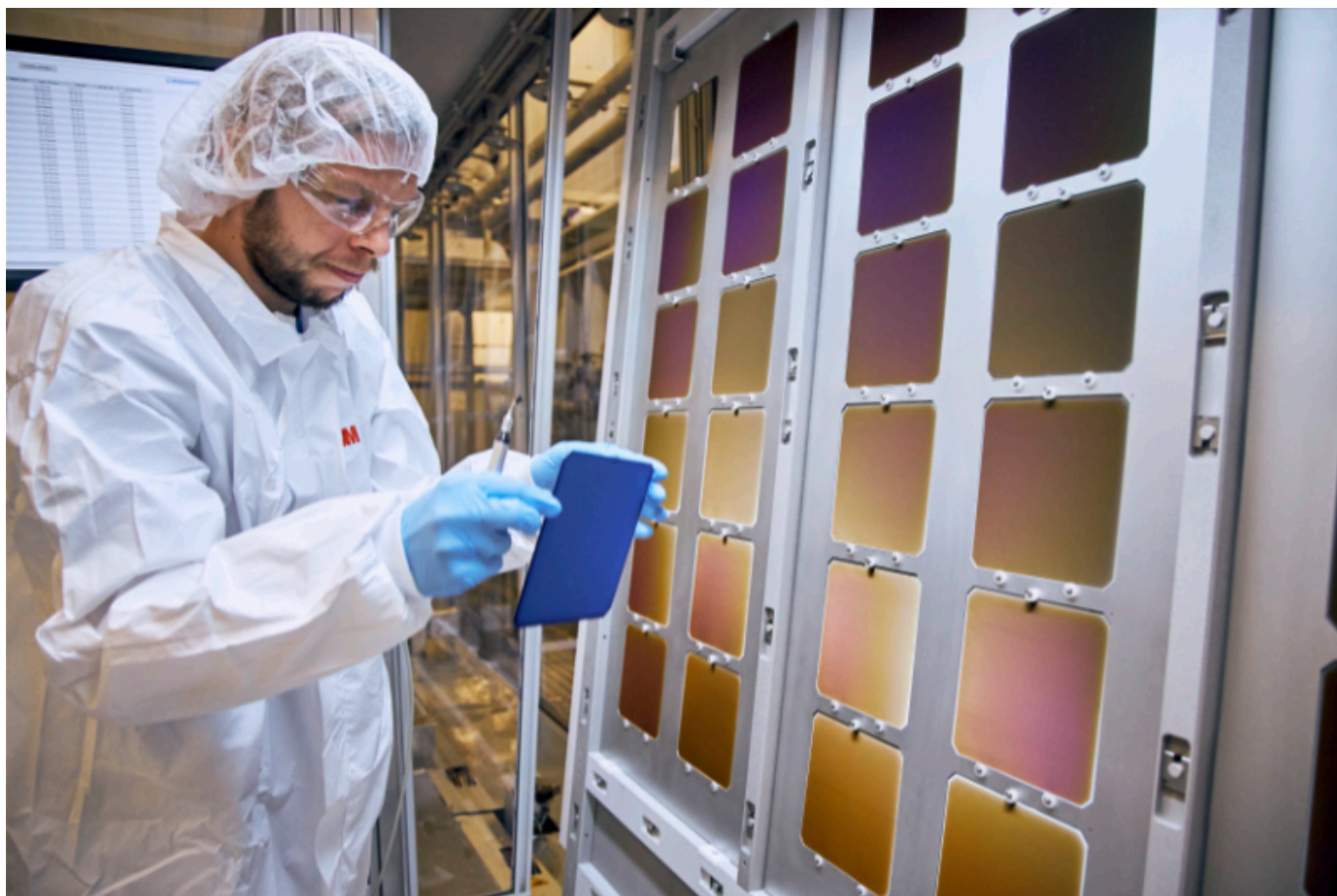
Oxford PV.

Die britische Oxford PV sieht sich als führendes Unternehmen auf dem Gebiet der Perowskit-Solarzellen. In Brandenburg an der Havel hat das Unternehmen die weltweit erste Produktionslinie für Perowskit-auf-Silizium-Tandem-Solarzellen mit einer angestrebten jährlichen Produktionskapazität von 100 MW aufgebaut. Ab 2022 soll dort produziert werden. Bis 2024 will das Photovoltaik-Unternehmen die Fertigung in der Havelstadt weiter ausbauen.