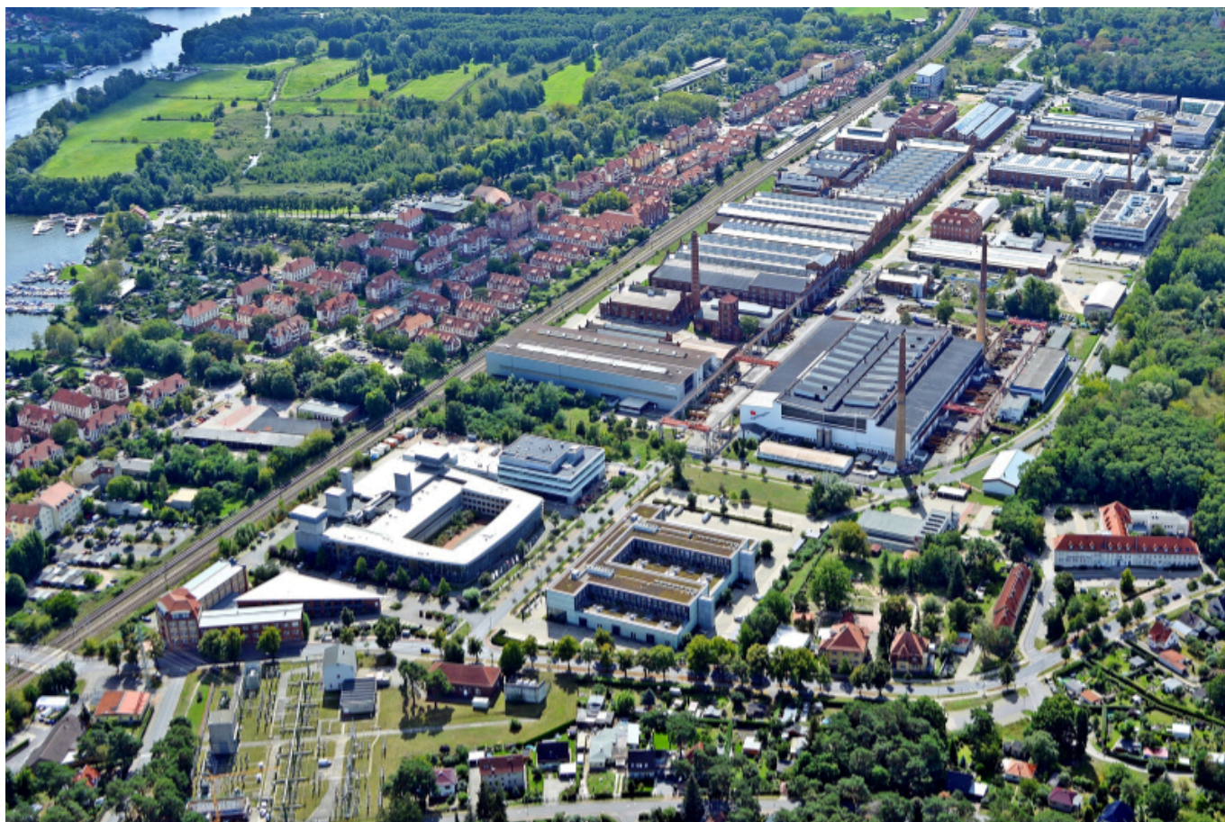
Wissenschafts- und Technologiepark Wildau

Dass sich die Region für Beschäftigte aus der ganzen Welt zu einem attraktiven Ort zum Leben und Arbeiten entwickelt hat, lässt sich auch maßgeblich auf die Gründung der Technischen Hochschule (TH) Wildau im Jahr 1991 zurückführen. Zurecht kann sie sich als Nukleus der Technologie- und Wissenschaftsregion bezeichnen, bietet sie doch mit 15 Studiengängen u.a. in naturwissenschaftlichen, ingenieurtechnischen und betriebswirtschaftlichen Disziplinen ein wichtiges Fundament für die Ausbildung der Nachwuchskräfte. Gleichzeitig ist auch für die Vernetzung der Wissenschaft gesorgt, denn in