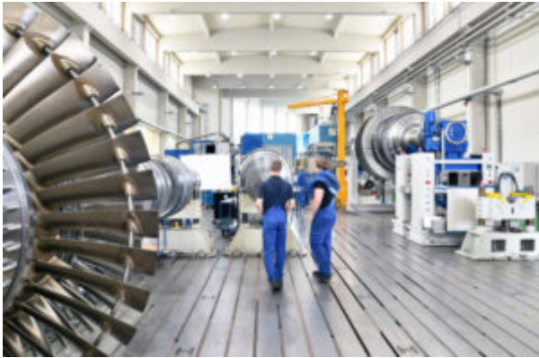
Maschinenbau