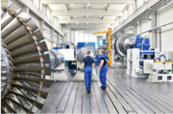
Maschinenbau (2)