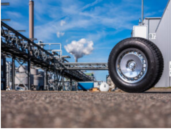
Reifen mit dem naturidentischen, biomimetischen Synthetikgummi BISYKA wurde am Fraunhofer PAZ entwickelt.

Am Fraunhofer-Pilotanlagenzentrum für Polymersynthese und -verarbeitung PAZ im ValuePark in Schkopau werden gemeinsam mit industriellen Partnern Polymersynthese- und verarbeitungsprozesse im industrienahen Maßstab durchgeführt. Das Fraunhofer PAZ ist die größte außerindustrielle Polymersyntheseeinrichtung Europas.