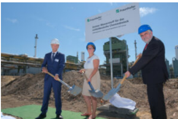
Spatenstich für die Elektrolysetest- und

Forschungsfelder: Nachwachsende Rohstoffe