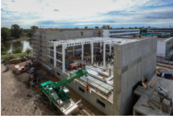
Blick auf die künftige Elbfabrik.

Das Fraunhofer-Institut für Fabrikbetrieb und -automatisierung IFF in Magdeburg forscht an innovativen Lösungen in den Aufgabenfeldern „Intelligente Arbeitssysteme“, „Ressourceneffiziente Produktion und Logistik“, „Konvergente Versorgungsinfrastrukturen“ und „Digital Engineering“. Dabei setzen die Wissenschaftler auf ihre Kompetenzen in der Robotik, beim Messen und Prüfen und bei der Gestaltung von Prozessen in Produktion und Logistik.