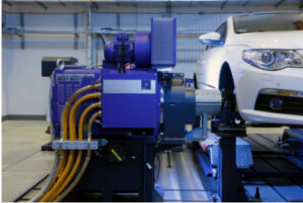
Am IKAM wird an neuen Antriebstechniken geforscht.

Das Institut für Kompetenz in AutoMobilität – IKAM GmbH mit Sitz auf dem Universitätscampus in Magdeburg sowie im Industrie- und Gründerzentrum