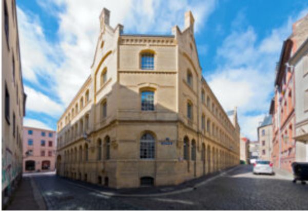
Außenansicht des IWH.

Das 1992 gegründete Leibniz-Institut für Wirtschaftsforschung Halle (IWH) gilt als die Stimme der wirtschaftswissenschaftlichen Forschung in Ostdeutschland. Neben aktuellen Erhebungen wie dem IWH-Insolvenztrend oder den regelmäßigen Konjunkturprognosen liefern die Forscher am IWH der Politik auch wichtige wissenschaftliche Erkenntnisse über den Strukturwandel in Ostdeutschland.