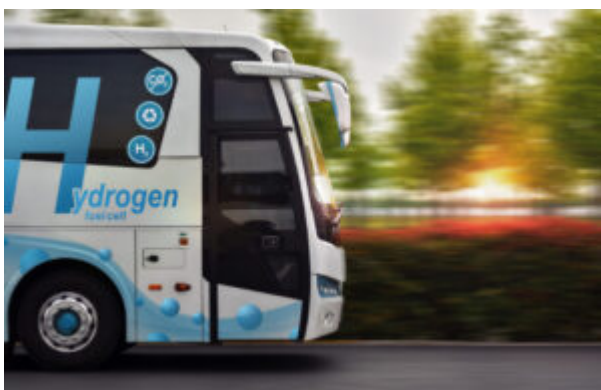
Wasserstoff-Bus als Beispiel für die Energiewende in Vorpommern-Rügen.

Forschungsfelder: Regenerative Energiesysteme