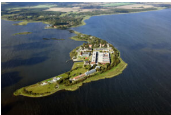
Das FLI auf der Insel Riems.

Ort: Greifswald – Insel Riems Forschungsbereich: Tiergesundheit