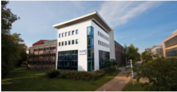
Das Leibniz INP in Greifswald.

Das Leibniz-Institut für Plasmaforschung und Technologie e.V. (INP) in der Hansestadt Greifswald zählt zu den größten außeruniversitären Forschungseinrichtungen für Niedertemperaturplasmen in Europa. Die Greifswalder forschen an plasmagestützten Verfahren und Technologien, die etwa zur Beschichtung von Oberflächen, zur Dekontamination von Lebensmitteln, zur Reinigung von Abwasser und Abluft, aber auch in der Medizin eingesetzt werden können.