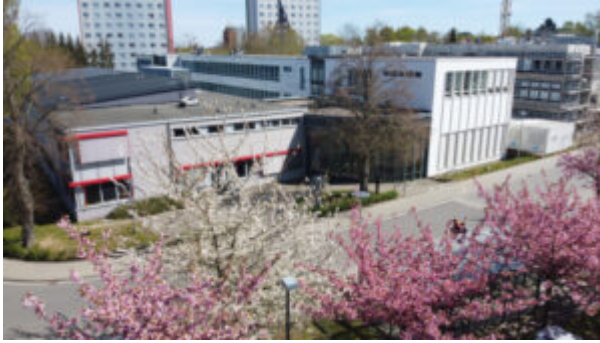
Die Gebäude des Fraunhofer IGP.

Das Rostocker Fraunhofer IGP erarbeitet gemeinsam mit Kooperationspartnern aus der Industrie Konzepte für Produkt- und Prozessinnovationen. Das Augenmerk gilt dabei dem Schiff- und Stahlbau, der Energie- und Umwelttechnik, dem Schienen- und Nutzfahrzeugbau sowie dem Maschinen- und Anlagenbau. Seit 2020 gehört das ehemals eigenständige Institut in der Rostocker Südstadt offiziell zur Fraunhofer-Gesellschaft und ist damit mit rund 200 Mitarbeitern das erste Fraunhofer-Institut mit Hauptsitz in Mecklenburg-Vorpommern.