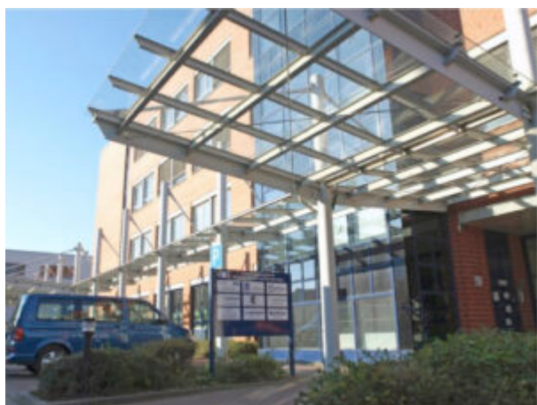
Eingang des Instituts für ImplantatTechnologie und Biomaterialien e.V.

Das Institut für ImplantatTechnologie und Biomaterialien e.V. (IIB e.V.) wurde 1996 im Rostocker Ortsteil Warnemünde gegründet. Das IIB ist eine gemeinnützige, außeruniversitäre und wirtschaftsnahe Forschungseinrichtung. Seit dem Jahr 2013 ist es zudem ein An-Institut der Universität Rostock. Der IIB e.V. beherbergt das Kompetenzzentrum für Medizintechnik Mecklenburg-Vorpommern und ist Partner des Mittelstand 4.0-Kompetenzzentrums Rostock.