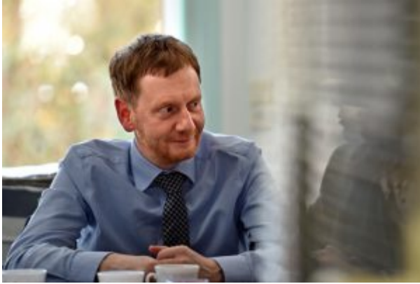
Ministerpräsident Michael Kretschmer