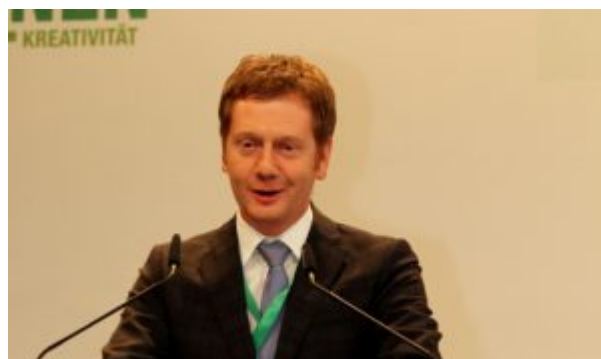
Michael Kretschmer

W+M: Wo liegen Ihrer Einschätzung nach aktuell die größten Defizite beim Zusammenwachsen von Ost und West?