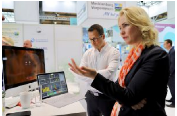
Manuela Schwesig ist viel in ihrem Land unterwegs und besucht dabei auch Mittelständler.

W+M: Im Herbst 2021 stehen in Ihrem Bundesland Landtagswahlen an. Möchten Sie Ihre Arbeit als Regierungschefin fortsetzen?