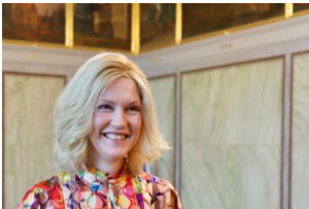
Manuela Schwesig im Interview, Foto: Staatskanzlei Mecklenburg-Vorpommern

W+M: Frau Schwesig, in diesem Jahr feiert Deutschland den 30. Jahrestag der Wiedervereinigung. Wie würden Sie den Stand der wirtschaftlichen Entwicklung Ihres Bundeslandes nach drei Jahrzehnten im geeinten Deutschland bewerten?