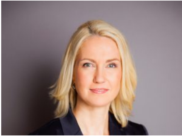
Manuela Schwesig, Ministerpräsidentin in Mecklenburg-Vorpommern.