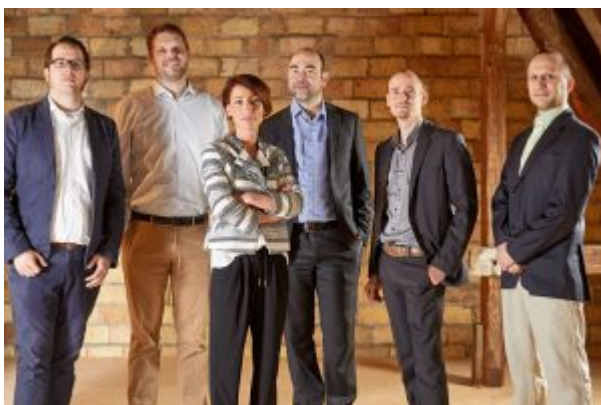
Das Gründer-Team der Industrial Analytics IA GmbH

Industrial Analytics IA GmbH – Mit innovativer Software gegen Ausfallzeiten