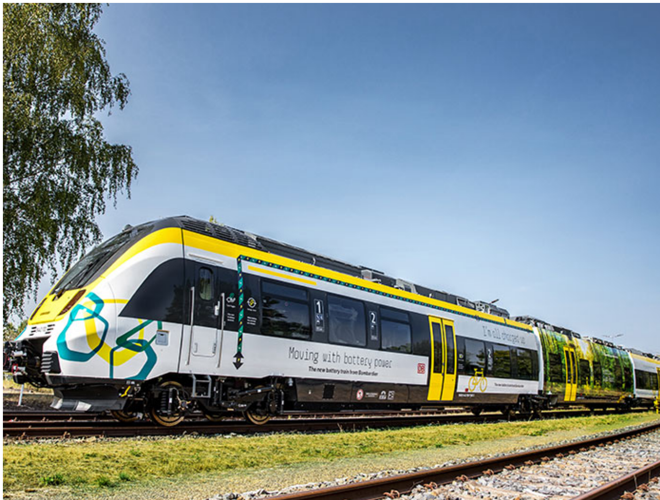
Umweltfreundlich: Bombardiers TALENT 3-Batteriezug

Bombardier Transportation mit Sitz in Berlin zählt zu den weltweit führenden Herstellern in der Bahnbranche. Mit dem BOMBARDIER TALENT 3-Batterietriebzug setzt der Konzern auf saubere Mobilität. Seine besonderen Kennzeichen: Er fährt emissionsfrei, energieeffizient und geräuscharm. Die Batterien werden während der Fahrt beziehungsweise an Haltestellen unter der Oberleitung oder mittels zurückgewonnener Bremsenergie geladen. Mit dem BOMBARDIER TALENT 3 können Bahnbetreiber nicht-elektrifizierte Strecken überbrücken und ihre Dieselfahrzeuge durch einen sauberen Batteriebetrieb ersetzen.