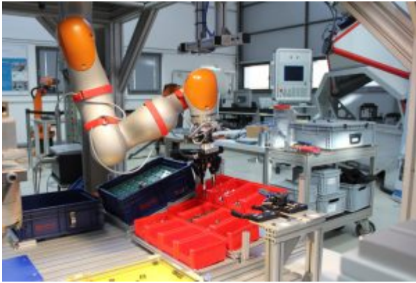
SME-Robotics-Zelle mit Leichtbauroboter

Gezeigt werden diverse Anwendungsszenarien, in denen auch kleine und mittlere Unternehmen, die meist nicht über hochspezialisierte IT-Fachkräfte verfügen, Roboter in der Produktion erfolgreich einsetzen können. Passend dazu organisiert das Kompetenzzentrum Seminare zur Einführung in die Programmierung von Industrierobotern, um das nötige Know-how bei den Firmen aufzubauen. Mithilfe solcher Veranstaltungen und Demonstratoren erhalten kleine und mittlere Unternehmen einen umfangreichen Einblick in die Möglichkeiten der Digitalisierung und können erproben, welches Verbesserungspotenzial bei den eigenen Prozessen besteht.